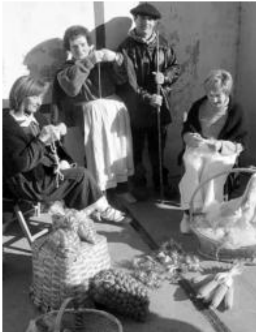
Artilea nola egiten den ikusi ahal izango da, joan den urtean bezala. A. OTEZABAL

Abenduak agintzen duen moduan, hotza egitea espero dute igandean. Bada, egunean bertan, taloak eta gaztain erre berriak ere prestatuko dituzte hotzari aurre egiteko, nahi dituenak dastatu ahal