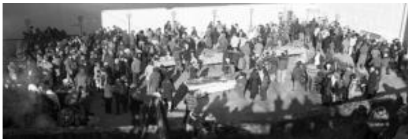
Iaz, jende andana bildu zen Bedaioko I. Azokan. Postu desberdin asko dago. ANDER OTEZABAL

izateko. Hala ere, joan den urtean abenduaren 16an egin zuten lehen aldiz azoka eta eguraldi atsegina izan zuten.