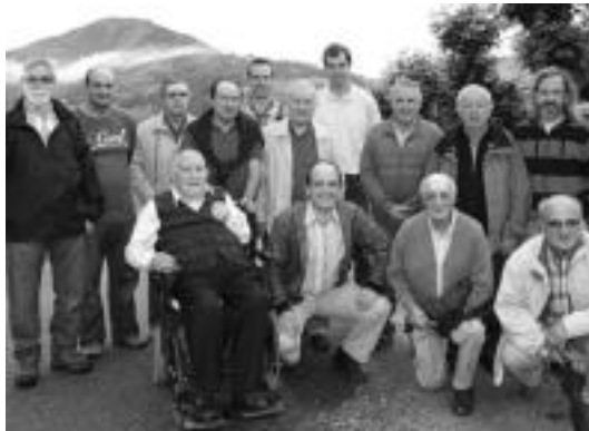
Alpino Uzturre Mendi elkartearen lehendakariak guztiak, hilik dauden bi eta Australian bizi den bat izan ezik. HITZA

41 kapitulutan zehar elkartearen sorrera, egoitza, lehen aktibitateak, mendi ibilaldiak, elkarteko kide batzuk egindako mendi (Kenia, Alpes, Pico Comunismo, Gashebrum II), eskalada (Cerro Torre) edo eski (Laponia, Groenlandia) espedizioak, antolatutako eski eta rolleski txapelketak eta Otsolako kanpamendua, egindako eskaladak, mendi bizikletako irteerak parte hartutako mikologia lehia-