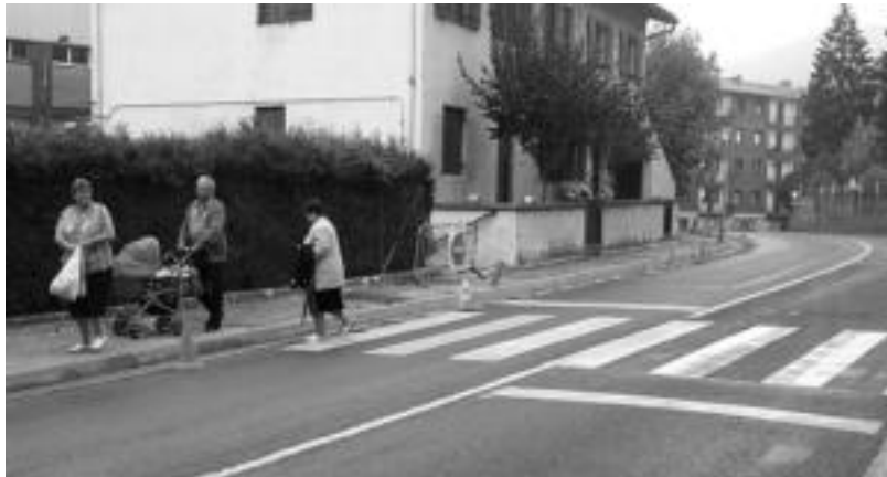
Elbarrena auzotik igarotzen den errepidean trafikoa gutxiagotuko du saihesbideak. I. GARCIA

Zizurkilgo saihesbidearen proiektuak 1,7 kilometroko ibiltar-tea gauzatzea aurreikusten du eta Adunako industrialdeko errepide-letokua Zizurkilgo eta Asteasu-ko industrialdetik Olentzoadera doanarekin. Nolanahi ere, jardun beharreko eremu horretako orografikoa tunel bat eta biribilgune bat eraikitzea eskatzen du, eta era horretan herriko zirkulazioa erre-