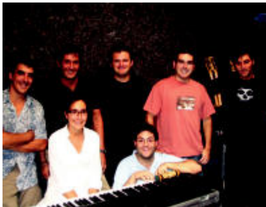
Profesta taldeko kideak ariko dira etzi Zerkausian.