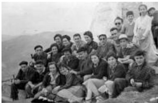
Mendi elkarteko kideak Uzturren aspaldiko argazkian.