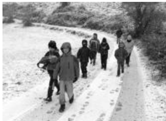
Azken egunean egindako ibilaldian 22 lagunek parte hartu zuten. HITZA

Datorren urtera begira proiektioak egiteko asmoa badute, baina «ikusirik beharko dugu nolako antolatu beharko ditugun», azaldu dute. Sagainekoak «oso gustura» daude Gazumen egiteko den parke eolikoari buruzko mahai-inguruak emandakoarekin, bai hizlariak eman zuten jokorekin bai