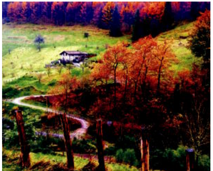
Bigarren saria jaso zuen Jokin Sukuntzaren Udazkenak inguratutik ek.